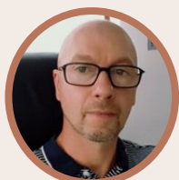
François Bauduin Expert en marchés publics et membre de la COMMISSION FÉDÉRALE DES MARCHÉS PUBLICS